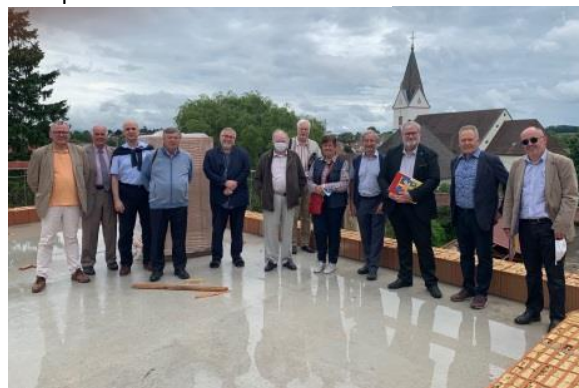
Une partie du Conseil d'administration en visite sur le chantier de l'espace Kolmer.

Cette activité comprend la gestion des dons et legs consentis par les bienfaiteurs, qui contribuent aux ressources de notre association et sont destinés aux dépenses d'entretien et de construction, comme l'Espace KOLMER.